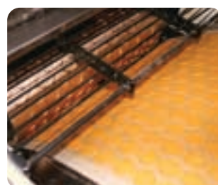
Machine de démoulage rotative utilisée dans la production d'articles de pâtisserie.

Les bandes sans fin en coton tissé se distinguent par une longévité et une faculté d'absorption à toute épreuve. Elles empêchent toute formation de résidus sur les produits déjà moulés. La faible pression sur le tissage en fait le compagnon idéal des machines de démoulage.