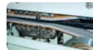
Les courroies de reprise de câbles exigent des tissages indéformables et des surfaces extrêmement résistantes à l'usure.

très peu de résistance au roulement. L'absence de jonction et les tolérances serrées de l'installation quant à l'épaisseur et la souplesse de la bande permettent d'obtenir des vitesses constantes de déroulement pouvant aller jusqu'à 1200 m/min.