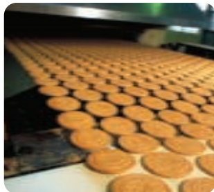
Bandes de transfert destinées aux fours.

Ammeraal Beltech possède ses propres installations de tissage et de revêtement pour la fabrication de bandes tissées, avec ou sans jonction, permettant d'offrir une grande variété de matériaux faisant appel à de nombreux fils naturels et synthétiques en coton, en chanvre, en polyamide, en polyester, en aramide, etc.