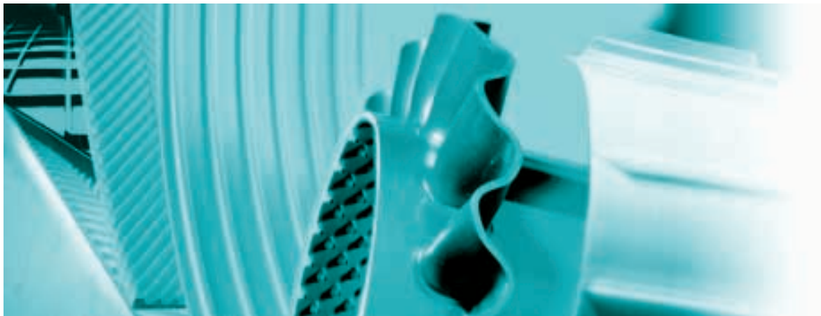
Nous vous fournissons une bande qui répond parfaitement à vos attentes, confectionnée selon la méthode qui convient.

techniques mises en œuvre pour la confection et le montage des bandes. Nos processus de production sont tous conformes au système d'assurance qualité de la série ISO 9000.