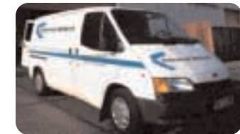
Notre réseau international offre un service après-vente unique en son genre.

Jusqu'à 24 heures sur 24 et à proximité, sept jours sur sept, 52 semaines par an: nous nous assurons que vos arrêts de production soient de courtes durées. Tous nos produits standards sont constamment disponibles en stock et peuvent être livrés et montés sans délai.