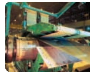
Production de tôles: enroulement serré garanti grâce aux bandes enrouleuses à courroie.

Les bandes tissées sans fin d'Ammeraal Beltech ont la solution qui convient à toutes vos applications, quel que soit votre secteur d'activité.